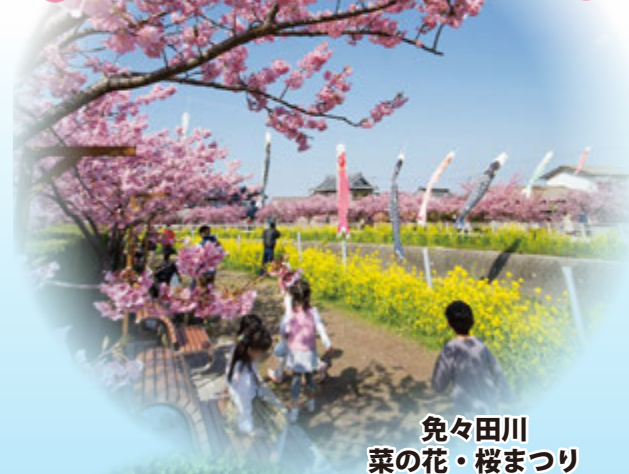
免々田川 菜の花・桜まつり